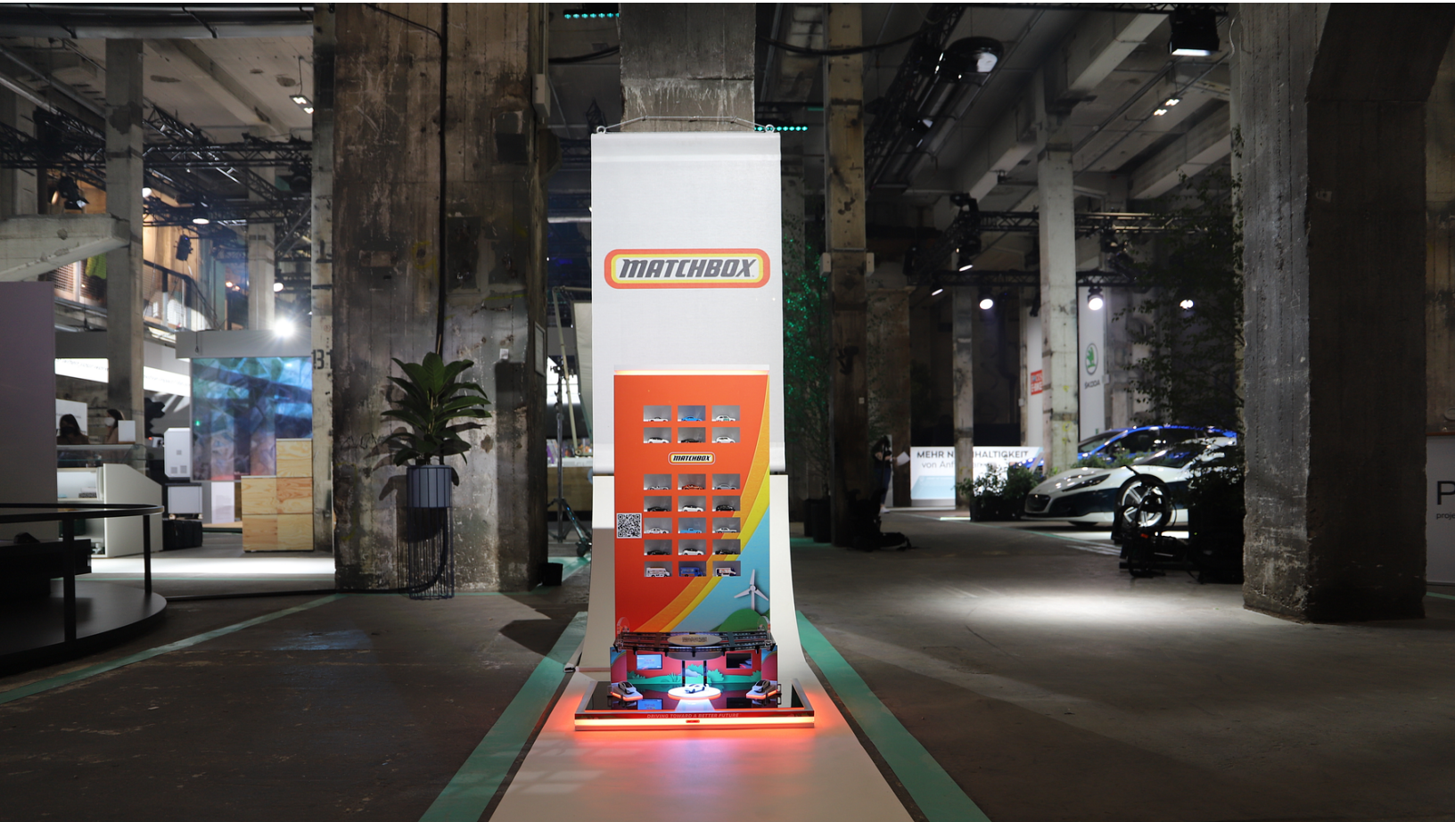
Matchbox auf dem Greentech Festival 2021 in Berlin